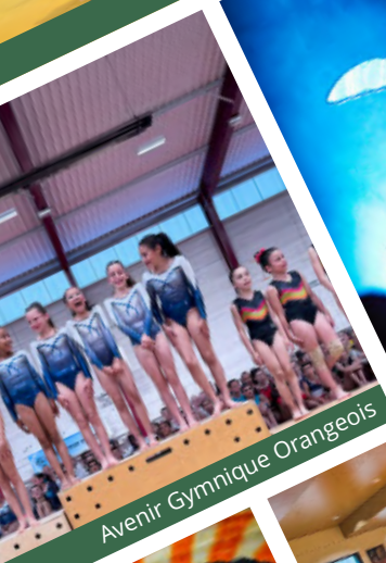
Avenir Gymnique Orangeois