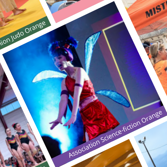
Association Science-fiction Orange