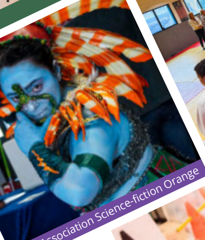
Association Science-fiction Orange