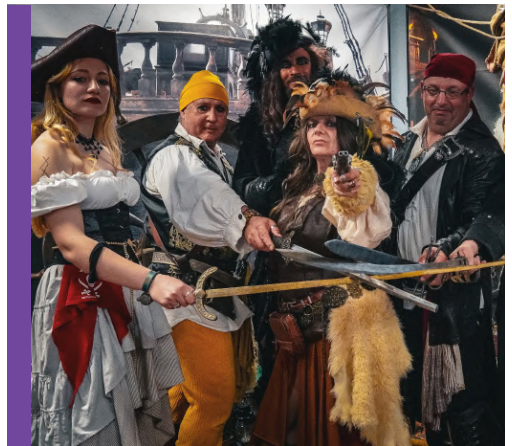
4 & 5 MAI 2024