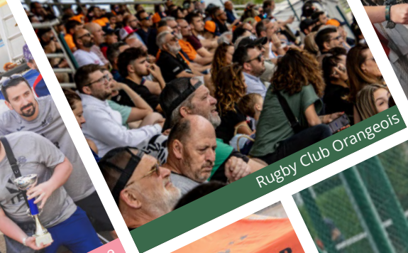
Rugby Club Orangeois