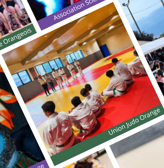
Union Judo Orange