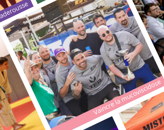
Vaincre la mucoviscidose