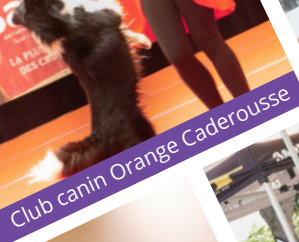
Club canin Orange Caderousse