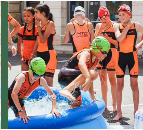
RELAIS DE LA FLAMME