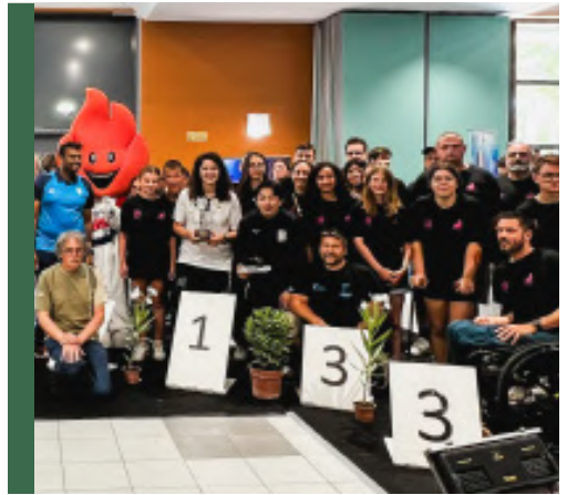
22 & 23 JUIN 2024