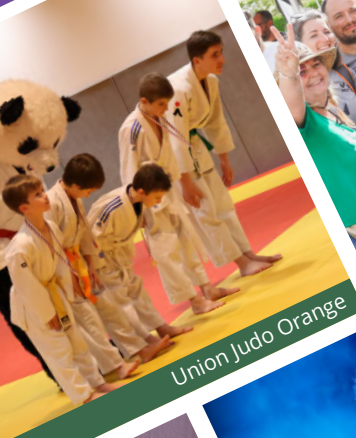
Union Judo Orange