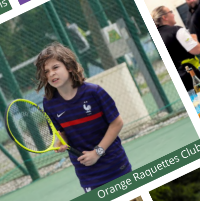
Orange Raquettes Club