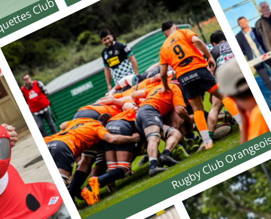
Rugby Club Orangeois