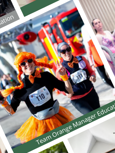
Team Orange Manager Educatif