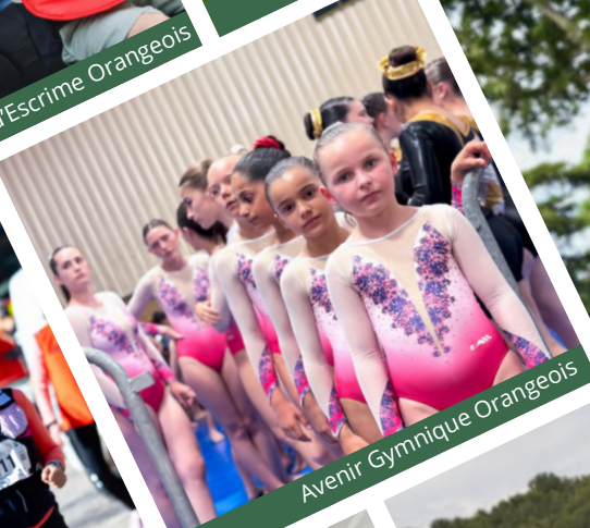
Avenir Gymnique Orangeois