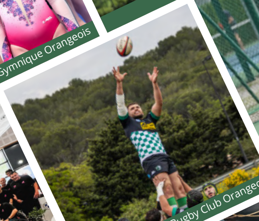
Rugby Club Orangeois