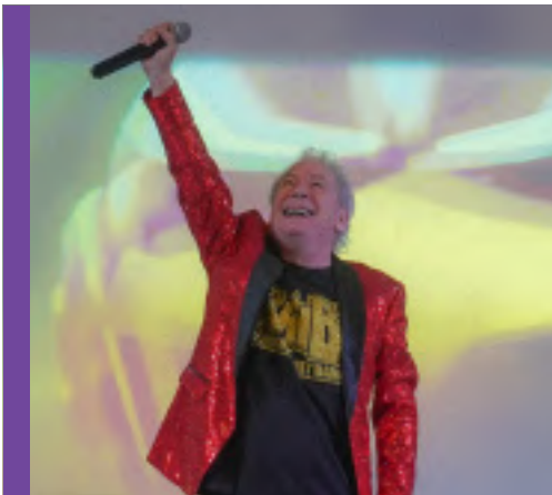
CONVENTION DE SCIENCE FICTION