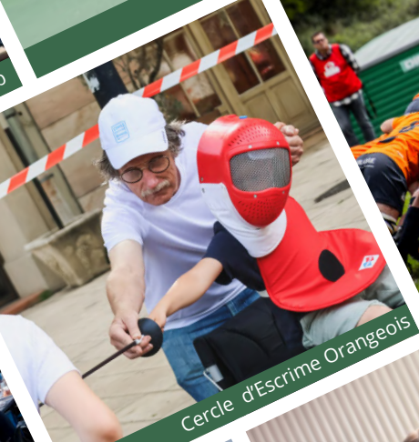
Cercle d'Esime Orangeois