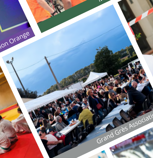
Grand Grès Associatif