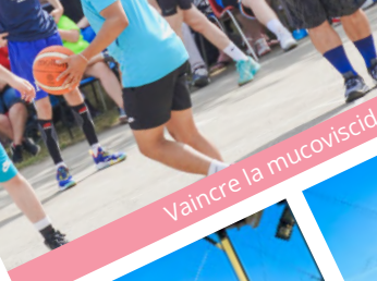
Vaincre la mucoviscid