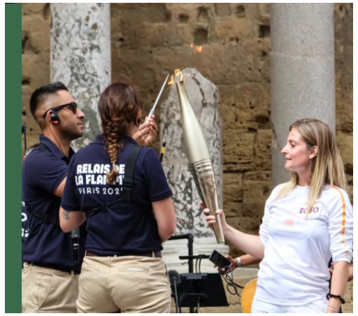
19 JUIN 2024