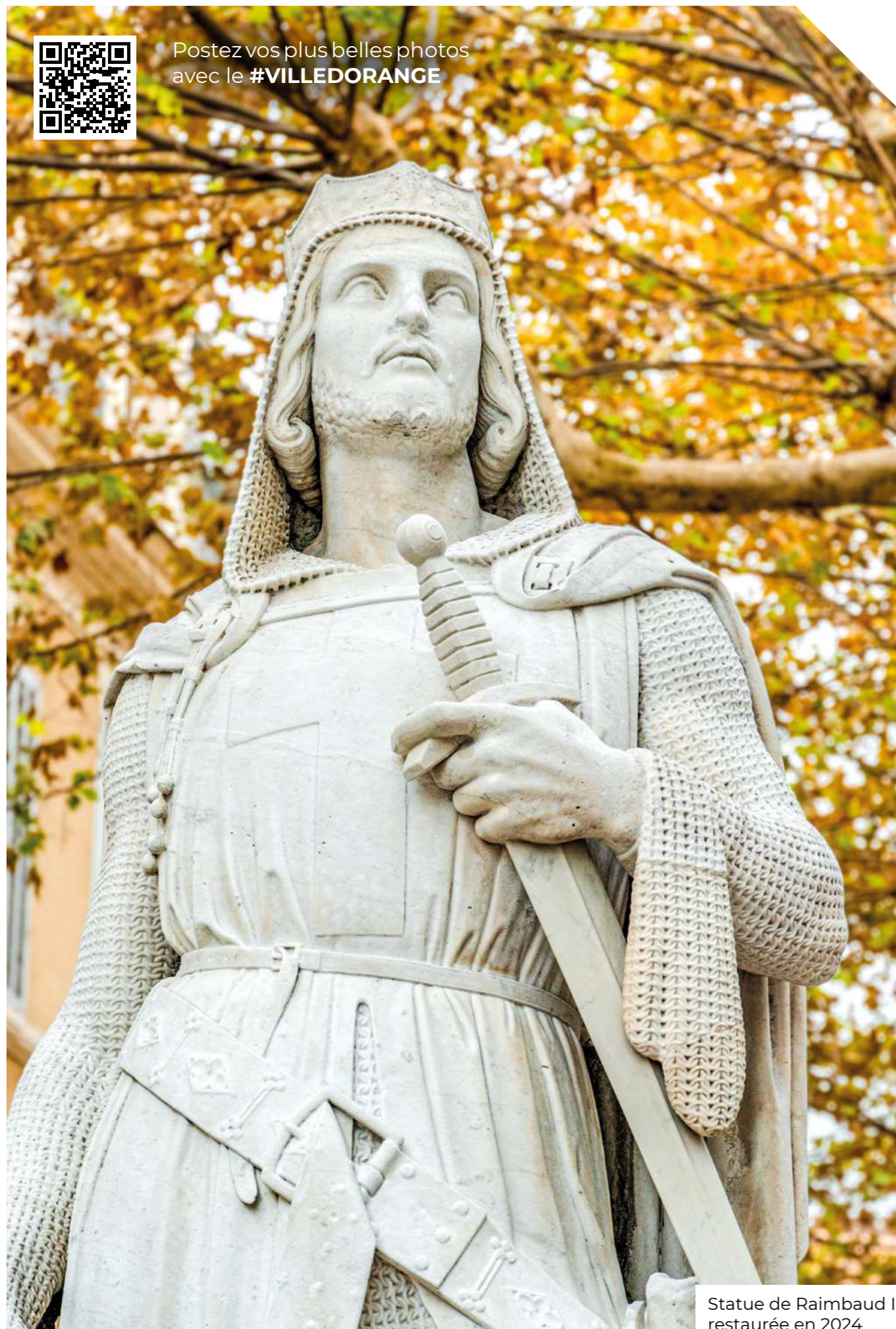
Statue de Raimbaud II restaurée en 2024

Postez vos plus belles photos avec le #VILLEORANGE