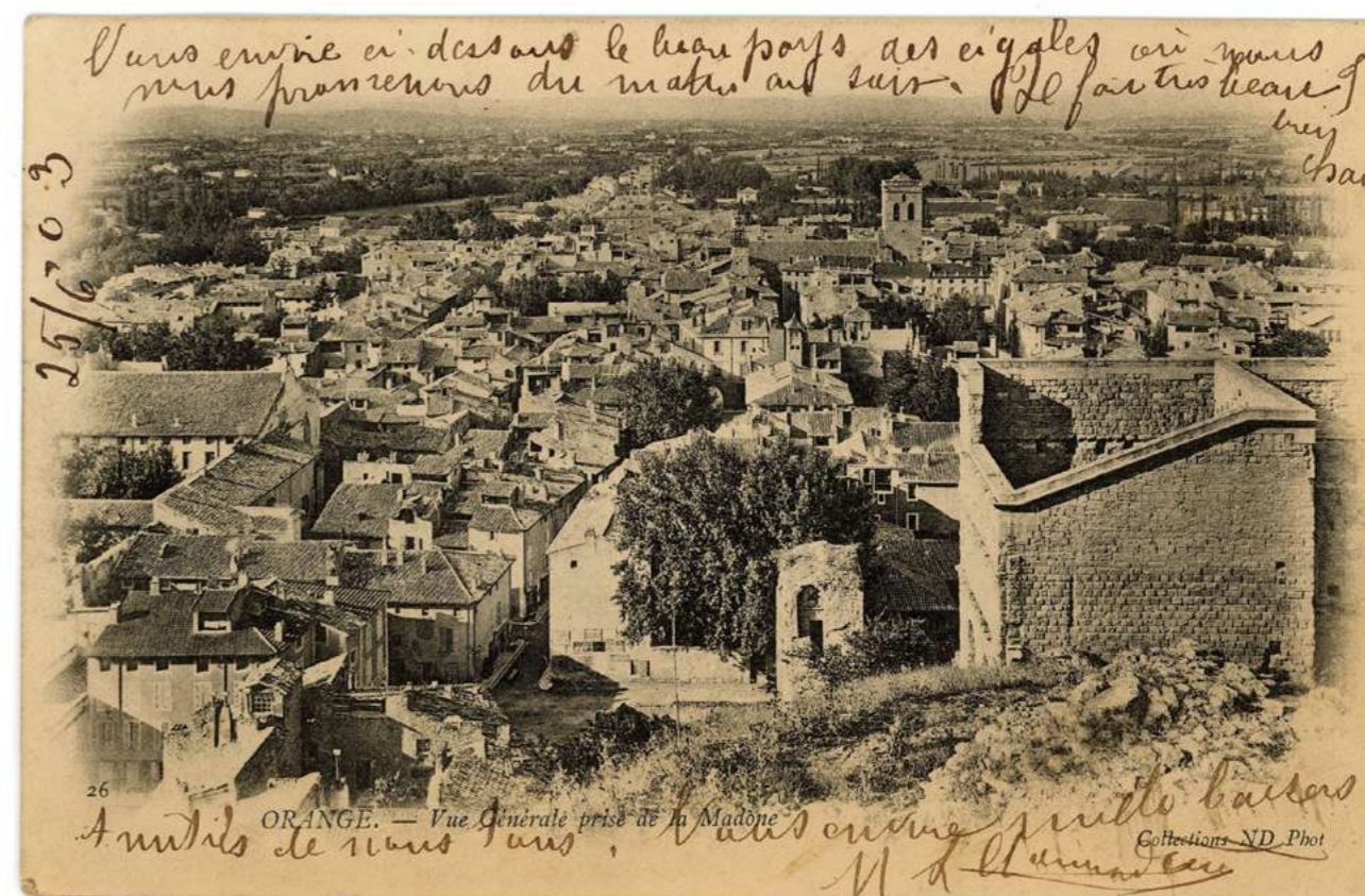
En 1903, les cartes étaient écrites sur le recto, le verso étant réservé à l'adresse. Nous pouvons lire : "Vous envoie ci-dessous le beau pays des cigales où nous nous promenons du matin au soir. Il fait très beau, bien chaud. Amitiés de nous tous. Vous envoie mille baisers."