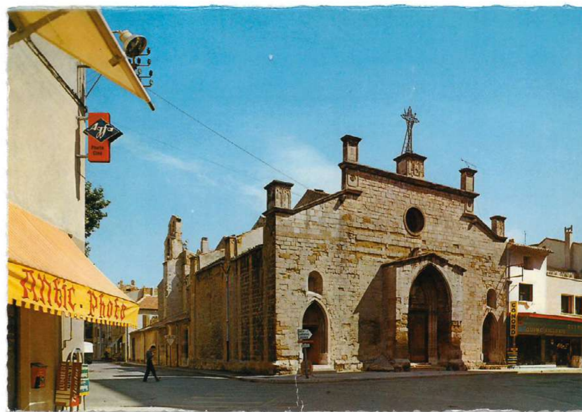
Découvrez l'église Saint-Florent sous le soleil des années 1970 !